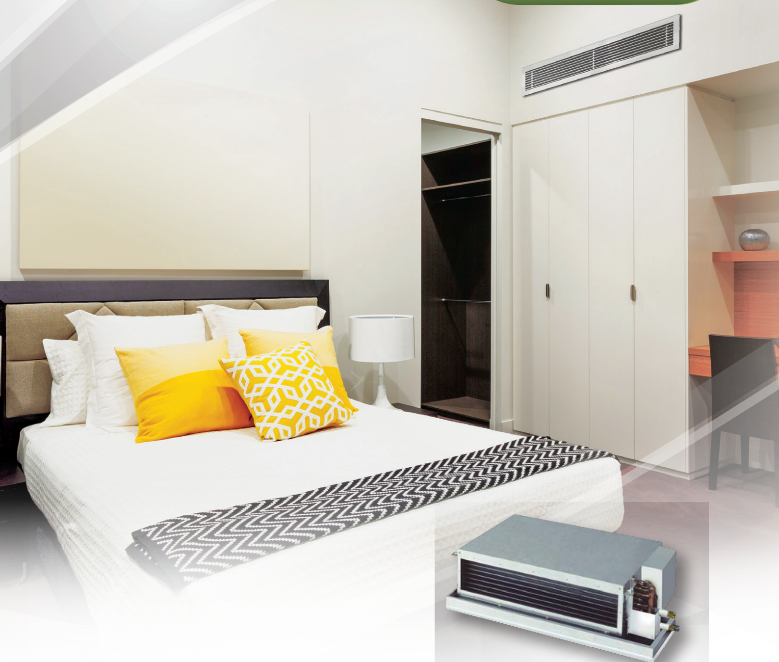
Air Conditioning system Cooling only (50Hz)